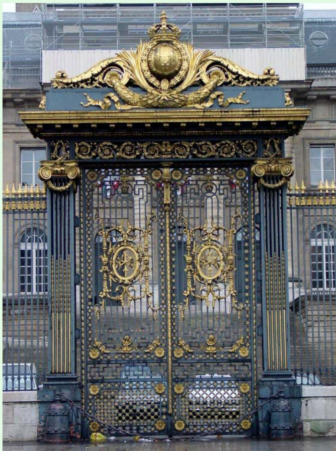
(圖 3：法國司法宮東側正面的華麗鐵門)