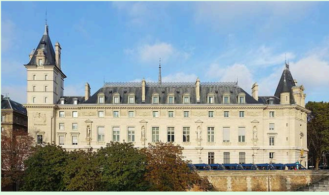
(圖 8：法國司法宮南側門面)