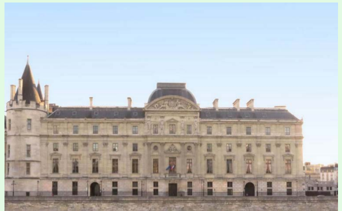
(圖 4：法國司法宮北側)