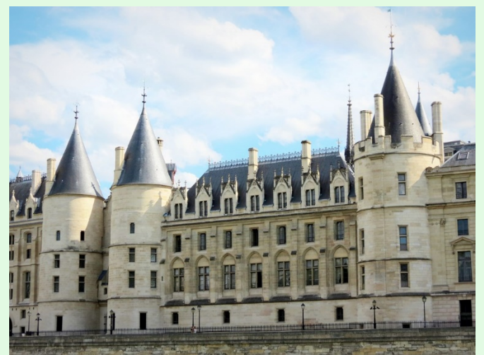
(圖 6：法國司法宮北側的巴黎古監獄)