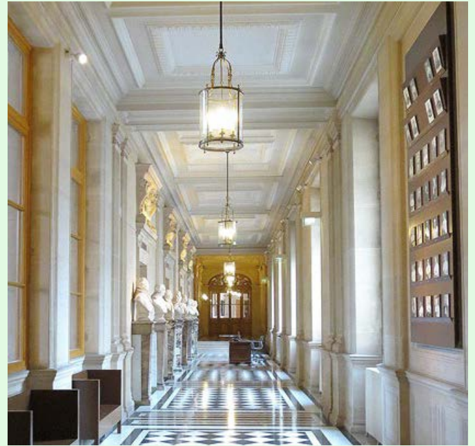
(圖 13：法國司法宮內部的半身人像走廊)