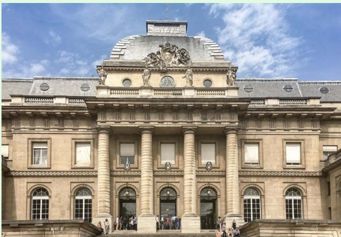
(圖 2：法國司法宮東側正面建築)