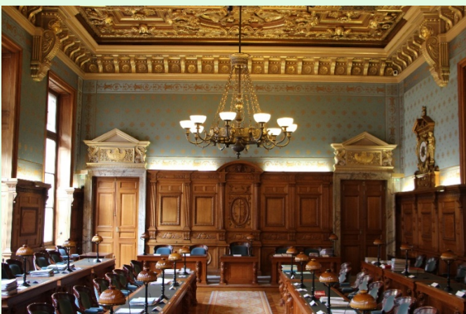
(圖 11：法國最高法院刑事庭)