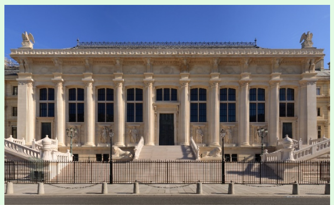
(圖 7：法國司法宮西側門面)