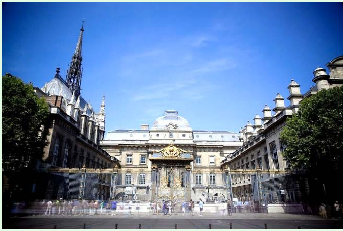
(圖 1：法國司法宮東側正面)