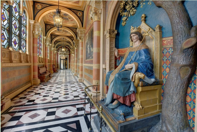
(圖 9：法國司法宮內部的聖路易走廊)