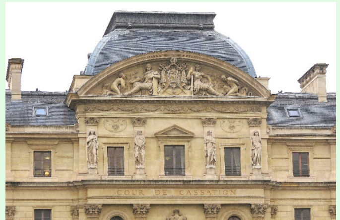
(圖 5：法國司法宮北側建築雕像)