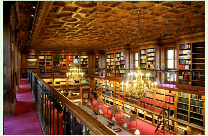
(圖 12：法國司法宮圖書館)