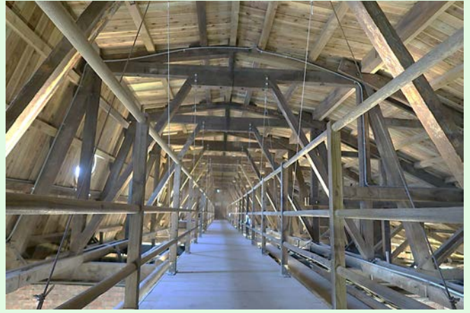
圖 10：司法博物館中的馬薩式屋架「貓道」