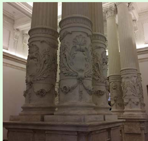
圖 6：司法博物館大廳華麗石柱