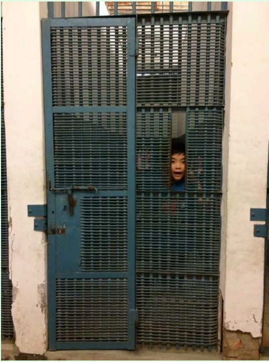
圖 14：司法博物館中的拘留所，圖中之人為老師的小孩