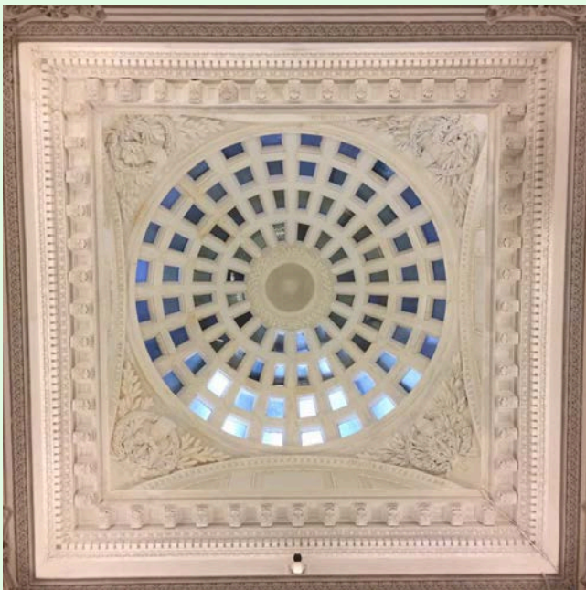
圖 8：司法博物館大廳上方的「圓拱窗」