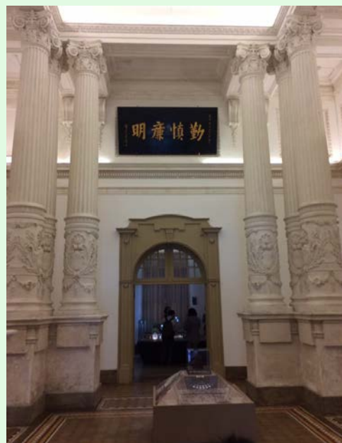
圖 5：司法博物館入內大廳