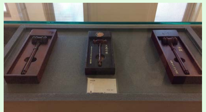
圖 13：司法博物館文物展示：法槌