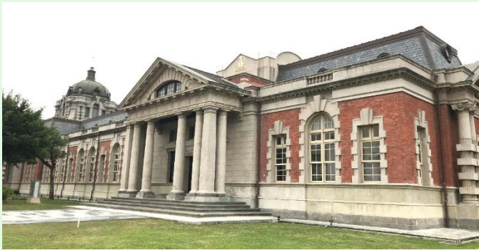
圖 1：司法博物館外觀