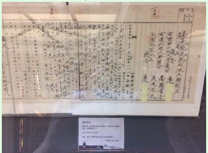
圖 12：司法博物館文物展示：判決書