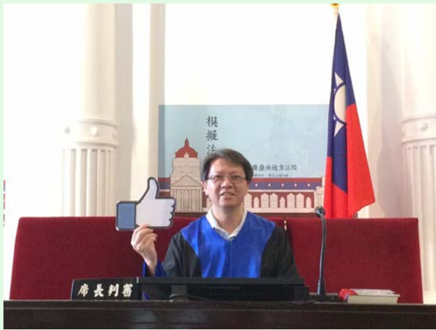
圖 15：司法博物館之法庭，可扮演法官角色留影紀念