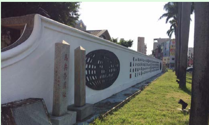
圖 3：司法博物館外牆與古蹟