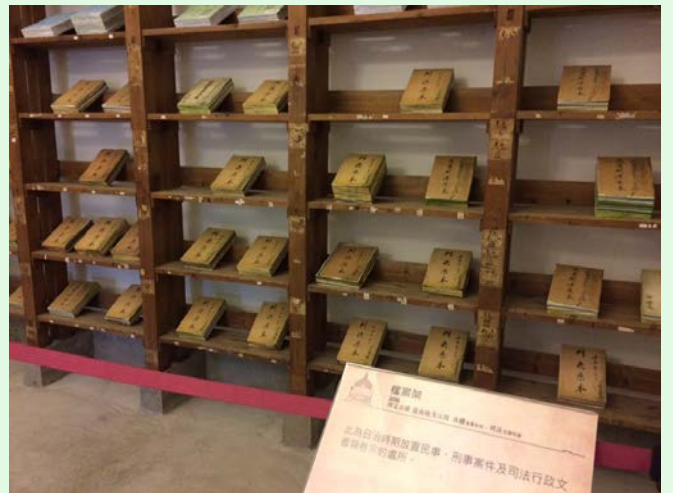
圖 11：司法博物館文物展示：檔案架