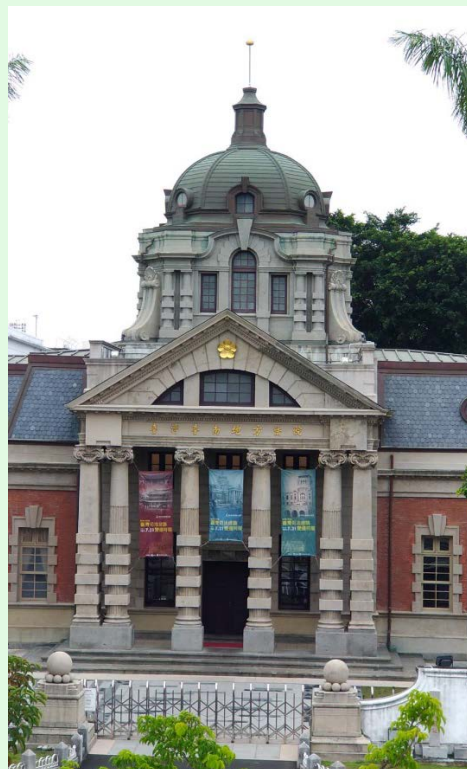
圖 4：司法博物館大門