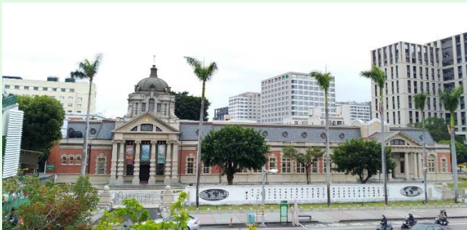
圖 2：司法博物館外貌全觀